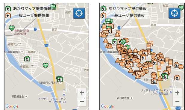
(a) 実験前 (b) 実験後

表 1 から、スマートフォンを利用している実験協力者の住民は 17 名中 2 名だった。実験協力者の学生は 16 名全員がスマートフォン利用者であった。表 5 より、システムの操作性については、実験協力者の住民よりも実験協力者の学生の方が評価が高かった。操作性に関する評価が高かった実験協力者の学生のアンケートより、「スマートフォンの操作に慣れていたので簡単だった」というコメントが得られた。実験協力者の学生は普段からスマートフォンを利用しているため、「あかりマップ」の操作は特に問題なく