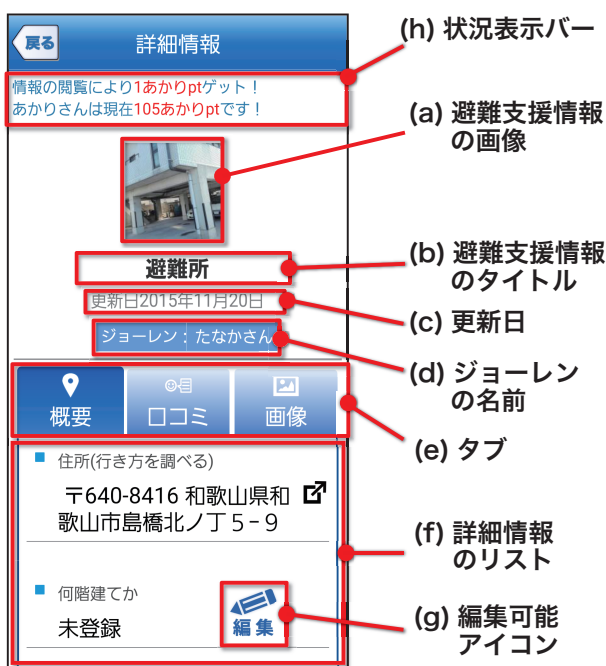
図 3 詳細画面例

に表示されているアイコンをタップすることで、吹き出しが出現し、避難支援情報の簡易情報を閲覧することが可能である(図 2(b))。画像のデータがある場合は、あわせて表示する。吹き出しをタップすることで、避難支援情報の詳細情報を閲覧することが可能である。詳細情報画面については、3.2.2 項で説明する。