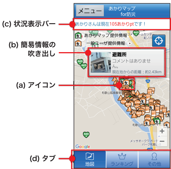
図 2 地図画面例