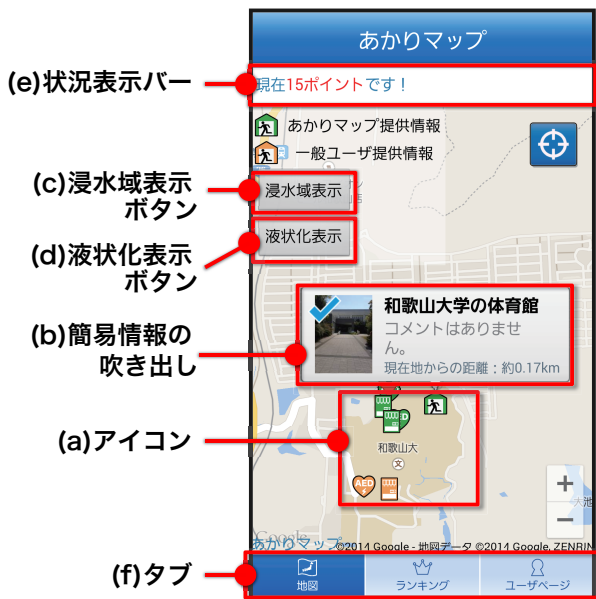
図 2 地図画面例

する。緑色のアイコンは「あかりマップ」にあらかじめ登録されている避難支援情報、オレンジ色のアイコンは「あかりマップ」の利用者が登録した避難支援情報である。吹き出しをタップすることで、避難支援情報の詳細情報を閲覧することが可能である。詳細情報画面については、3.3.3項で説明する。浸水域表示ボタンを押すことで浸水域 *3 となっているエリア、また液状化表示ボタンを押すことで液状化地域となっているエリアが表示される(図 2(c)(d))。