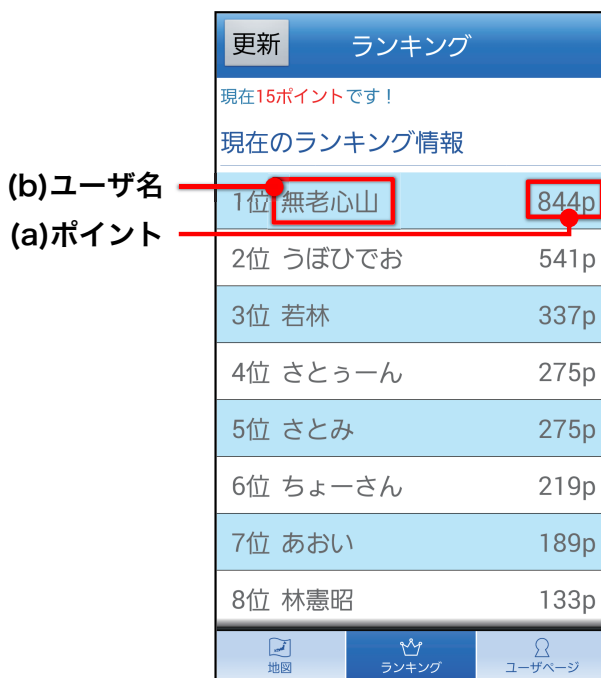
図 4 ランキング画面例

たコメントを閲覧することで、その避難支援情報に対する理解を深めることを支援する。