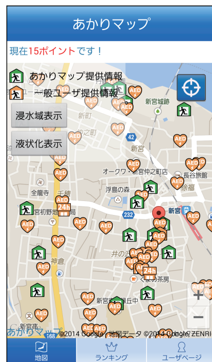
表 6 より、AED の新規登録が一番多かった。また表 3 より、実験協力者 B、D は自治体や消防署から AED や避難場所の情報を取得し、比較しながら登録していた。これは、AED が置いてある場所の情報を自治体が管理しており、実験協力者がその資料をもとに登録を行ったためである。

表 5 から、実験協力者が新規登録した避難支援情報は全 211 件であった。図 5 において、緑色のアイコンがあらかじめ入つていた避難場所のデータである。オレンジ色のアイコンは、実験協力者が実験期間中に登録した避難支援情報である。図 5 より、システムに登録されていなかった AED やコンビニエンスストアの場所を、実験協力者が登録していたことがわかる。