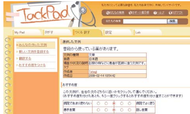
図 1: TackPad の画面例

そこで、本稿では形態素解析器と Web 検索を用いた用例間評価手法を提案する。本手法では、形態素解析器は言語グリッド *1 を、Web 検索は Google 検索 *2 をそれぞれ利用した。