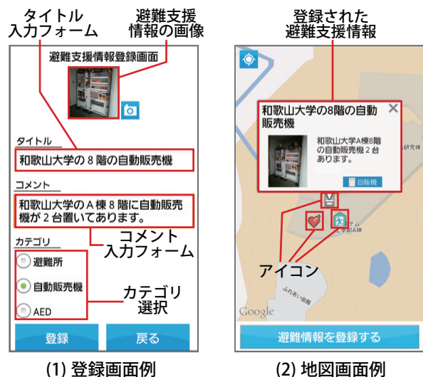
図 2: システム画面例