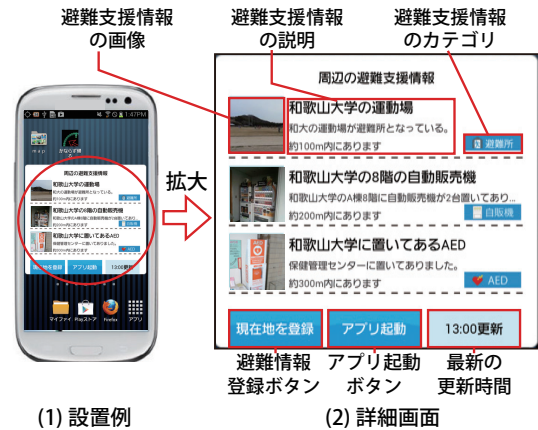
図 3: ウィジェット画面

本機能では、災害発生前のオンライン時に、利用者の位置情報を定期的にサーバに送り、それをもとにした避難支援情報を携帯端末へ保存する。これにより、外出先の知らない土地などでも、自動的に避難支援情報を受け取ることができる。